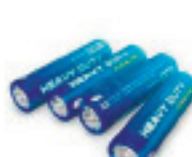
Батарейки 110 лет