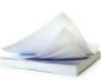
Офисная бумага 2 года