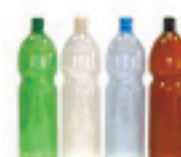
Пластик 180-200 лет