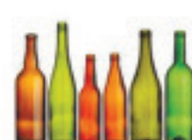
Стекло 1000 лет

Прежде чем выкинуть газету на дорогу, подумайте, что еще целых 4 месяца она будет лежать под вашими ногами.