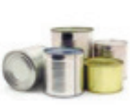
Жестяные банки 10 лет