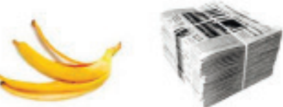
Пищевые отходы 30 дней