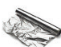
Фольга 100 лет