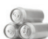
Алюминиевые банки 500 лет