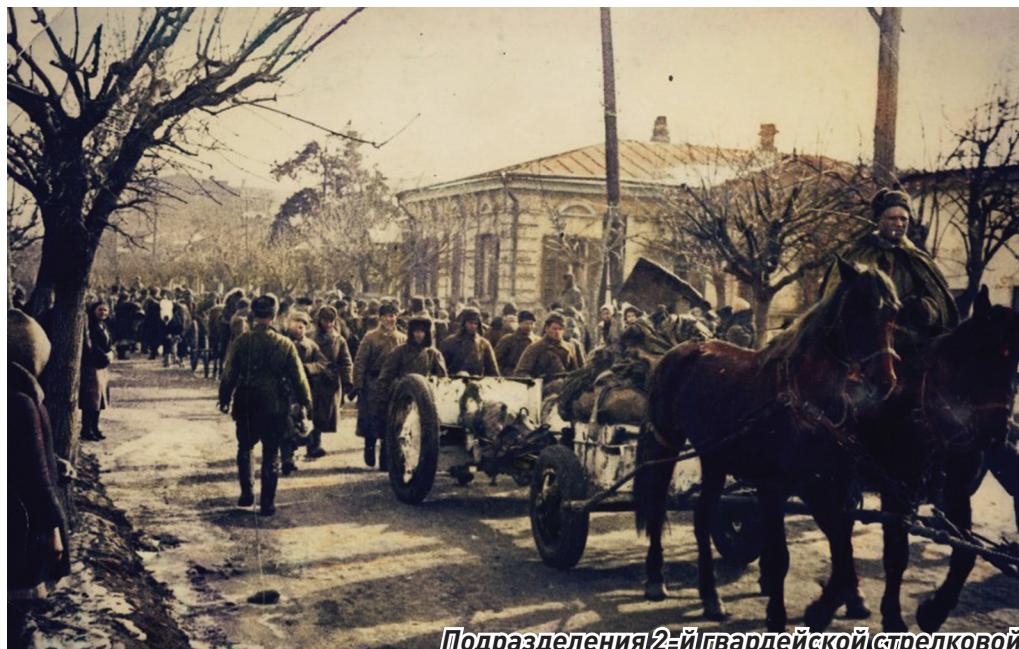
Подразделения 2-й гвардейской стрелковой (будущей Таманской) дивизии входят в освобожденный Краснодар

В этом году Краснодар отмечает 76 годовщину освобождения от немецко-фашистских захватчиков.