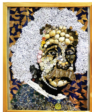
«ПОРТРЕТ АЛЬБЕРТА ЭЙНШТЕЙНА»