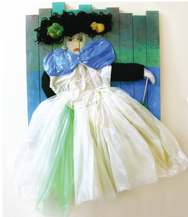
«ЖЕНЩИНА В ГОЛУБОМ»

сотрудники организационно-экологической службы АО «Мусороборочная компания»