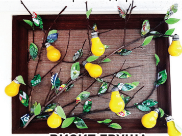
«ВИСИТ ГРУША, НЕЛЬЗЯ СКУШАТЬ»

сотрудники организационно-экологической службы АО «Мусороборочная компания»