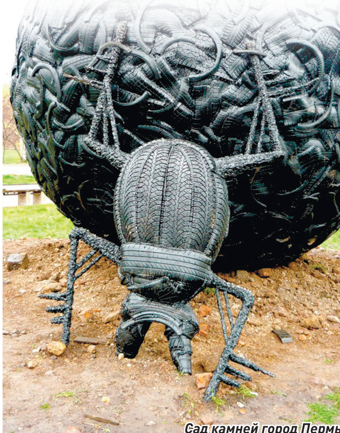
Сад камней город Пермь

Сегодня сбор автошин пунктами приема вторичных ресурсов менее актуален, чем сбор макулатуры или пластика, но не менее важен. В городе Краснодар имеются не менее